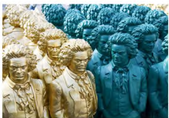
Οι διοργανωτές των εκδηλώσεων στη Βόννη, γενέτειρα του συνθέτη, αποφάσισαν να παραταθεί το έτος μέχρι τον Σεπτέμβριο του 2021, προκειμένου να υλοποιηθεί ένα πρόγραμμα 300 και άνω εκδηλώσεων.

Μπετόβεν, καθώς εκείνες τις μέρες μαέστροι και μουσικοί σε όλο τον κόσμο ξεκινούσαν τα πρώτα αφιερώματα στον σπουδαίο συνθέτη πριν το έτος του «κοπέι» στη μέση εξαιτίας του κορωνοϊού. Η πανδημία σάρωσε όλες τις προγραμματισμένες συναυλίες και ακυρώθηκαν όλες οι εκδηλώσεις που δεν μπορούσαν να μεταφερθούν στο Διαδίκτυο.